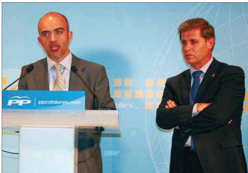
El XII Congrés del PPC podria desbancar Sirera de la presidència abans de l'any de mandat

nom i sensiblement diferenciat del referent estatal. Després d'uns resultats electorals discrets, els populars catalans saben que la possibilitat de ser un partit de govern a Catalunya i desbancar els socialistes passa per diferenciar-se del PP estatal, sobretot en qüestions com les nacionals, on l'anticatalanisme d'alguns dirigents populars ha deixat el PPC en una posició de marginació política. Només així es podrien apropar posicions amb formacions com ara Convergència i Unió (CiU), que ja ha manifestat la importància que la cúpula popular avanci cap a la moderació. CANVI ha demanat als tres aspirants a la presidència del PPC quina ha de ser la cara del partit que sortirà del Congrés. ■