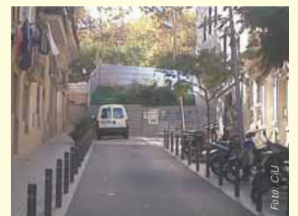
Recasens demana que el carrer Poeta Cabanyes enllaci amb el passeig de l'Exposició