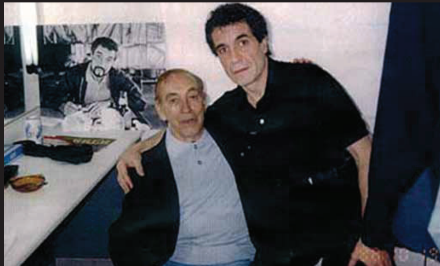
Rubianes amb el còmic madrileny Miguel Gila, amic i referent del "galaicocatalà".