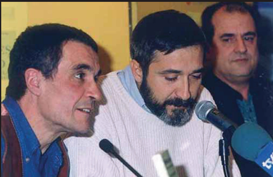
Rubianes amb Xavier Sardà i Carles Flavià a la presentació del llibre Rubianes, payaso .