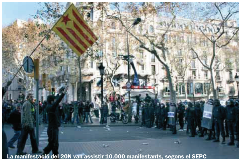
La manifestació del 20N van assistir 10.000 manifestants, segons el SEPC