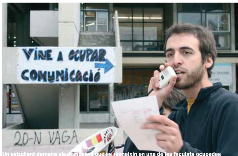
Un estudiant demana als companys que es reunixin en una de les facultats ocupades

Segons el portaveu nacional del SEPC, Arnau Mayol, l'aplicació del model Bolonia discrimina els estudiants i dificulta l'especialització en l'ensenyament universitari